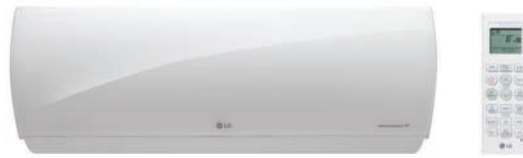
H09AK / H12AK