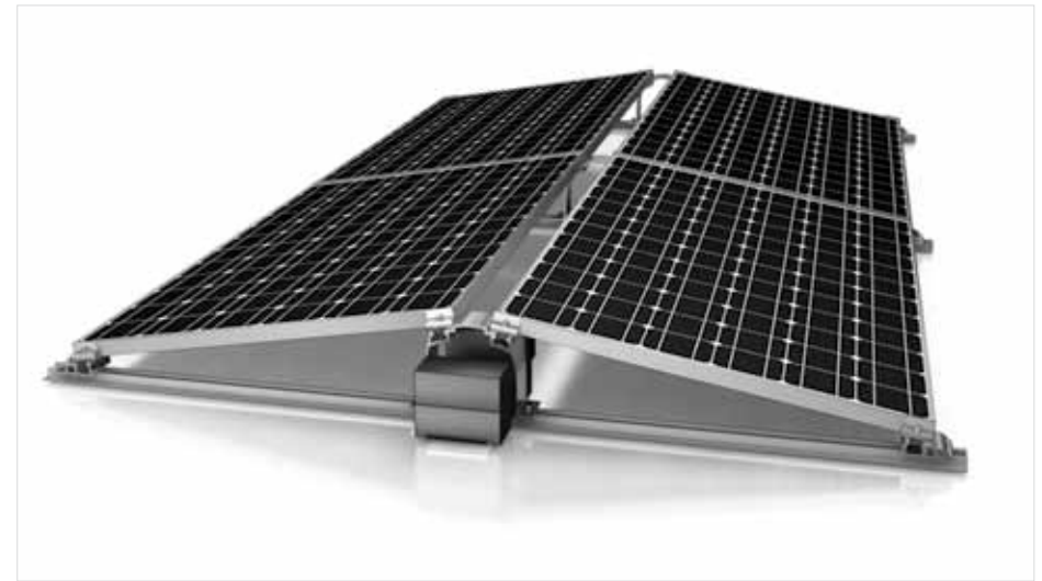
Detalje illustration – D-Dome System